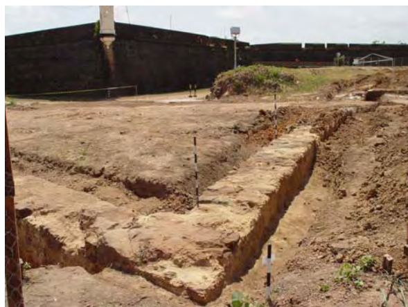
Figura 5 - Ângulo saliente do caminho coberto, em frente ao revelim. Descoberta arqueológica.