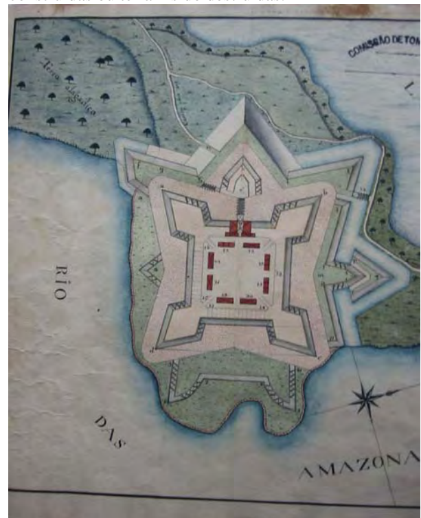
Figura 1 - Planta da Fortaleza de São José de Macapá que mostra o Estado em que se achava a Construção das Obras projectadas quando no Anno de 1773 se mandarão suspender.

Internamente a Fortaleza fora restaurada na segunda metade do século XX. Entretanto das obras externas de defesa registradas na iconografia, apenas restavam aparentes o fosso e um revelim. As demais obras projetadas, supunha-se, ou não haviam sido construídas ou teriam sido destruídas.