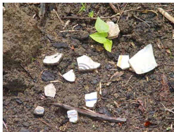
Figura 19 - material arqueológico (faiança grossa) encontrada em uma 'roça', nas proximidades.

Da Vila Vistoza da Madre de Deus, resta apenas a memória inscrita nos documentos. Diante da população atual nem mesmo se mantêm as memórias transmitidas através das gerações. O quanto resta do traçado da antiga vila, de suas construções não se sabe ao certo. Abandonada, foi tomada pela mata que hoje esconde pelo menos parte de suas ruínas; vestígios daqueles tempos que poderão ser resgatados arqueologicamente.