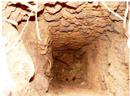
Figura 10 - Lacuna deixada no alicerce pela desintegração da madeira do esteio.

apenas havia sido empregado madeira e taipa. As cobertas seriam em palha.