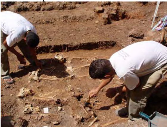
Figura 13 - Escavação da área dos sepultamentos.

Tijolos modelados, especialmente confeccionados para formar colunas cilíndricas, na área do altar, traziam ainda parte da pintura colorida também utilizada nas paredes.