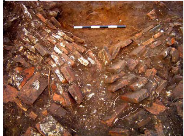
Figura 15 - Detalhe de parte do frontão da igreja tombado. A escavação detalhada permitiu reconstituir-se virtualmente a fachada da igreja.

especialmente construído no atual cemitério do povoado, para recebê-los.