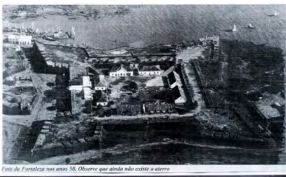
Figura 3 - Antiga foto aérea onde se observa embarcações junto à Fortaleza.

O porto que se instalou ao lado da Fortaleza, foi decorrente do igarapé que controlava o volume das águas do antigo Lago Macapá, assinalado na iconografia. Projetara-se utilizar um desvio de suas água para alimentar o fosso hídrico que envolvia o baluarte de São José. Em algum tempo as águas fugiram ao controle, espreado, dominando a área externa de uma das faces da Fortaleza.