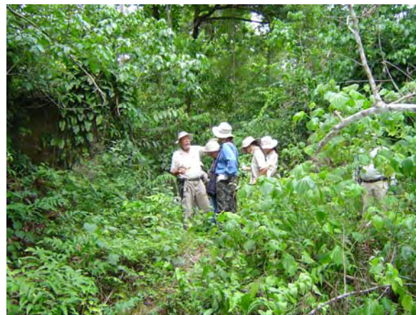
Figura 17 - Área onde foram localizados os primeiros remanescentes das ruínas.

Até o momento apenas foram realizadas as prospecções preliminares e a limpeza da área no entorno da ruína. Cuidou-se nesta etapa do trabalho de buscar afastar a vegetação envolvente em um perímetro de segurança para as estruturas.