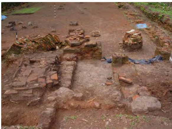
Figura 14 - Restos das colunas tombadas na área da nave.

A nave da igreja guardava ainda os restos mortais de muitos dos primeiros mazaganistas e seus descendentes. Durante a escavação os restos mortais foram exumados e recolhidos a um mausoléu