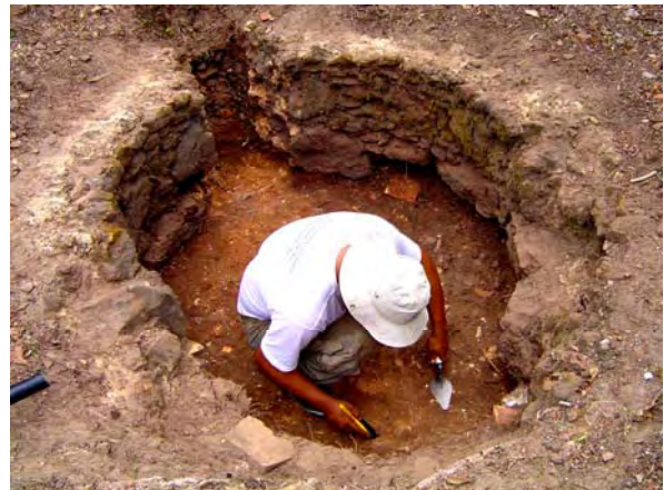
Figura 16 - Detalhe da escavação do poço localizado ao lado da igreja.