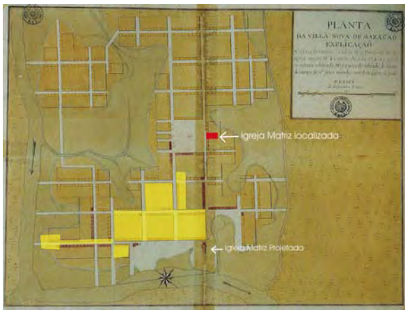
Figura 8 - Sobre planta de Sambucetti, assinalado em amarelo a dimensão atual do povoado. Estão ainda assinaladas as posições da matriz, no projeto e a posição das ruínas localizadas.

Por outro lado, do ponto de vista do traçado urbanístico, a igreja localizada nas proximidades do rio, de acordo com a planta da cidade, divergia das práticas de então, quando a matriz era, quase sempre posicionada no conjunto da praça principal, compondo com a casa de Câmara, o pelourinho, e demais prédios públicos.