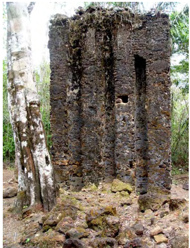
Figura 11 - Marcas deixadas nas paredes que permaneceram em pé, pelos esteios incrustados em seu interior.

Este não foi o quadro revelado pela análise das ruínas. Certamente as paredes estruturais da igreja foram em pedra, com esteios de madeira. Grossas madeiras, algumas em sua forma natural, cilíndricas, outras lavradas com cerca de 30cm de lado.