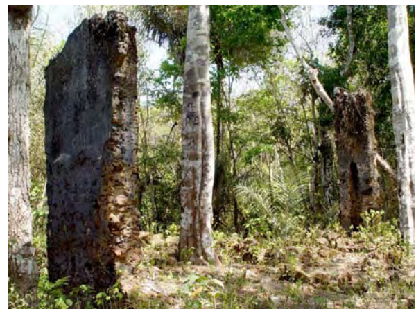
Figura 7 - Aspecto das ruínas antes da pesquisa arqueológica.

Um ponto entretanto, chamava a atenção. A presença de ruínas de uma construção em pedras, em meio à floresta que circunda o povoado, fora da área habitada.