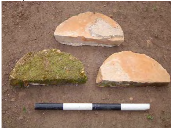
Figura 12 - Tijolos em hemi-círculo.

Os arcos construídos em tijolos com argamassa de cal, definiam aquelas áreas reservadas aos sacerdotes. As colunas tombadas preservaram alguns detalhes de adorno que as revestia.