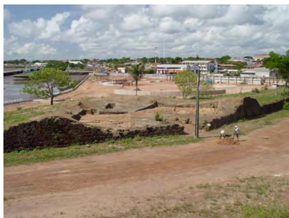
Figura 6 - Redente resgatado através da pesquisa arqueológica.