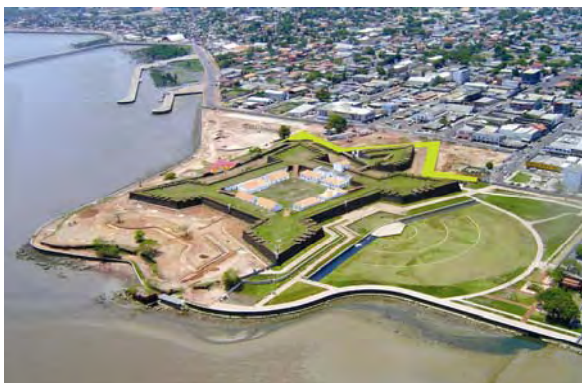
Figura 2 - Foto aérea da Fortaleza, modificada para assinalar o local das descobertas.

por aterros, escondida por toneladas de metralha, lixo e construções recentes, foi resgatada pela pesquisa arqueológica.