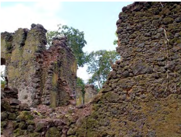
Figura 21 - Outro aspecto das paredes em ruínas.