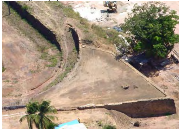
Figura 4 - Praça de armas no ângulo saliente sobre o caminho coberto, descoberto através da pesquisa arqueológica.

sobretudo considerando-se a época de sua construção e o contingente populacional da área no período.