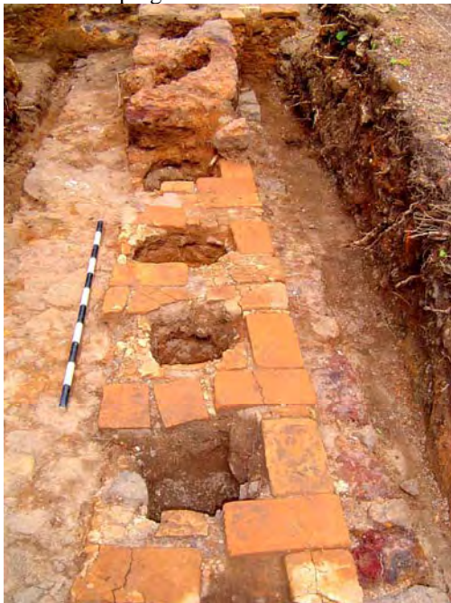
Figura 9 - Vista do alicerce da parede da nave onde se pode observar a seqüência de lacunas decorrente da decomposição dos esteios de madeira. No limite do alicerce, a partir de onde teria início a parede, a estrutura era nivelada por uma camada de tijolos.

Um outro aspecto revelado pela prospecção realizada diz respeito à técnica de construção utilizada e ao material empregado.