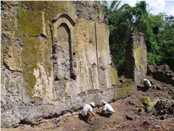
Figura 20- Aspecto da ruína, já com a vegetação afastada.

recuperar-se parte da história que não foi escrita em palavras mas poderá ser reescrita através de seus elementos materiais preservados pelo registro arqueológico.